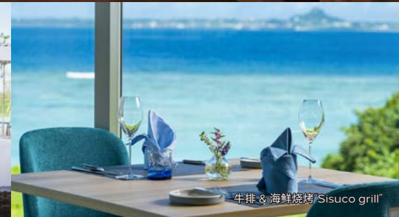
牛排 & 海鲜烧烤“Sisuco grill”