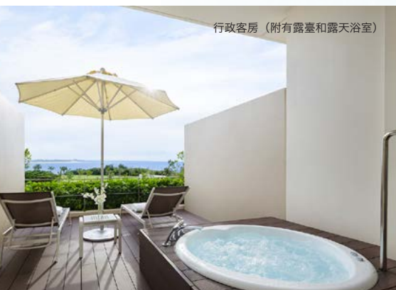
行政客房 (附有露臺和露天浴室)