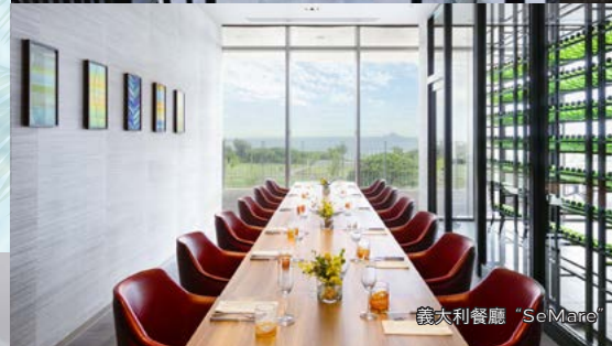
義大利餐廳 "Se Mare"